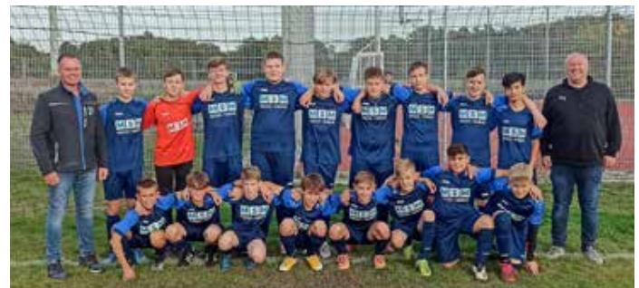
C-Jugend JSG Blau-Weiß 29 (Jahrgang 2009)

Die C-Jugend II trainiert montags und donnerstags von 18.00 – 19.30 Uhr auf dem Wesendorf Sportplatz.