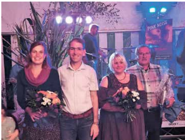
Übergabe Erntekrone 2022

Auf Ihr/euer Kommen freut sich die Freiwillige Feuerwehr Westerholz, die Volkstanzgruppe Westerholz, Junge Leute Westerholz, der Festausschuss.