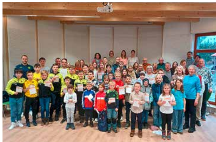
Gruppenbild mit allen Erwachsenen, Jugendlichen, Kindern und dem Abnahme-Team nach der Ausgabe der Sportabzeichen.