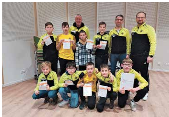
Stolz zeigten sich auch die Spieler der D- und E-Jugend. Mannschaft des VfL Wahrenholz mit ihren Betreuern über die erfolgreiche Beteiligung an der Sportabzeichenabnahme.